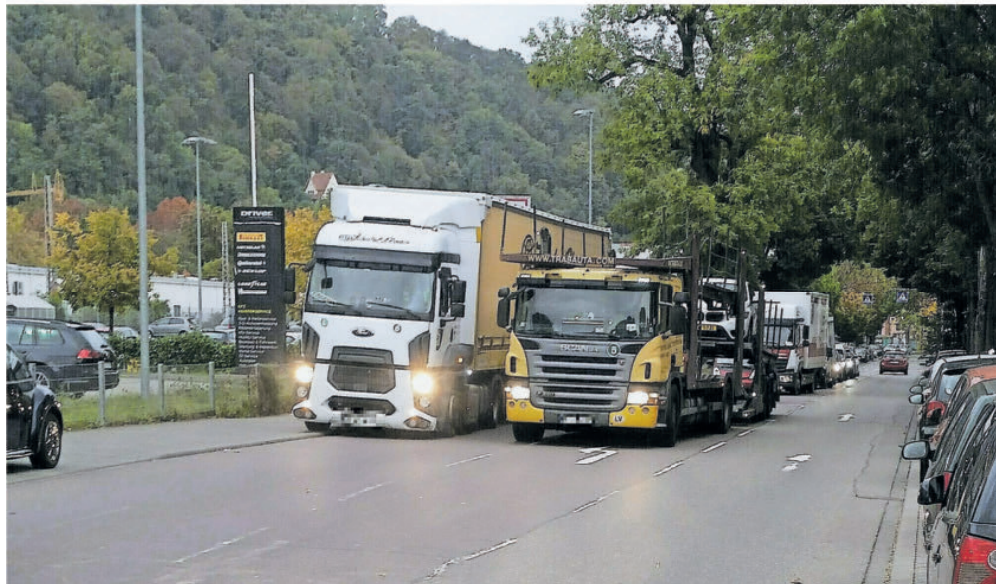
Am Morgen stauen sich Fahrzeuge in der Aachener Straße vor der Sperrung am Römerbrückenkopf. Zum Wenden nutzen Fahrer bevorzugt die Parkplätze der anliegenden Firmen.